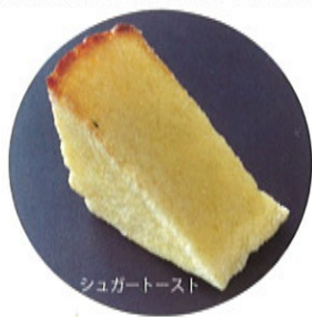
シュガートースト

芽室高校では、芽室町のパン屋さん「りすドン」のパンを購入できます (火～金曜日 昼)。 美味しいパンがたくさん！人気のパンをご紹介します。