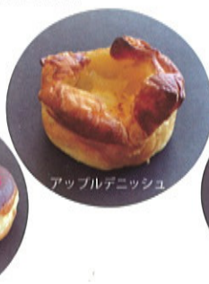
アップルデニッシュ