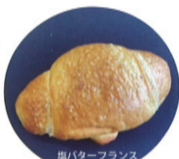
塩バターフランス